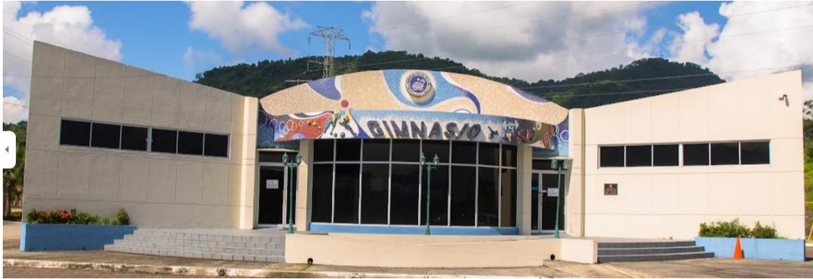
Figura 1. Imagen de las instalaciones del Gimnasio de Bienestar en el campus Gustavo Galindo V.